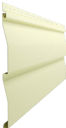
Сайдинг D4,5D (корабельный брус 4,5")